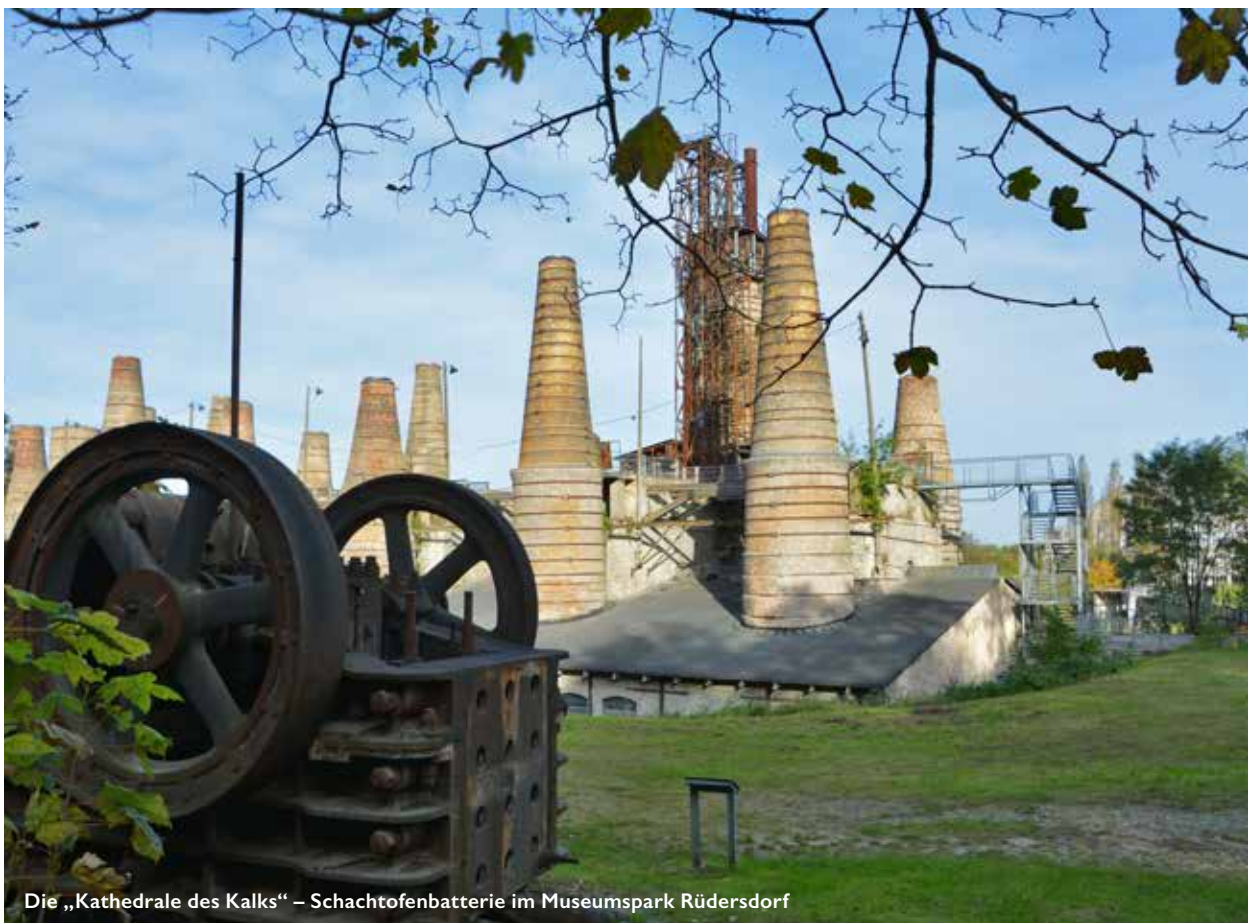
Die „Kathedrale des Kalks“ – Schachtofenbatterie im Museumspark Rüdersdorf

In der Ausgabe „Freilichtmuseen Teil I“ lag der Fokus auf Einrichtungen, die sich der Darstellung und Bewahrung einer vergangenen ländlich-bäuerlichen Kultur widmen. Diese Ausgabe richtet den Blick eher auf Freilichtmuseen und Museumsparks mit industriellen, technischen oder auch sehr konkreten historischen Bezügen.