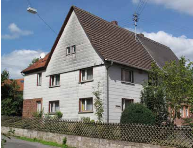
Abb. 8 Odenwälder Freilandmuseum Walldürn- Gottersdorf, 1950er Jahre Haus, Haus Bär (2012)

Die jüngste Gründung eines Freilicht-, Freiluft- oder Freilandmuseums ist vermutlich für das Jahr 2000 zu verzeichnen. Es handelt sich um das „Museum für Volksarchitektur Schwarzbach“ im Landkreis Mittelsachsen (Abb. 7). Seine Entstehung ist dem Engagement eines Vereins zu verdanken, wie dies auch von manchem älteren Freilichtmuseum bekannt ist.