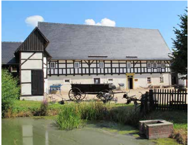
Abb. 7 Museum für Volksarchitektur Schwarzbach (Königsfeld, Landkreis Mittel- sachsen), Haus aus Doberenz (2013)

Wie in Skansen sollte das vorrangige Anliegen dieser Einrichtungen die Dokumentation einer vorindustriellen, weitgehend agrarisch ausgerichteten Gesellschaft sein. Dieses Konzept übernahm auch Ottenjann für Cloppenburg. Es ging ihm um ein ganzheitliches Bild einstiger Lebensverhältnisse. Um diesem Anspruch gerecht zu werden, bedurfte es auch umfangreicher historischer Grundlagenforschung.