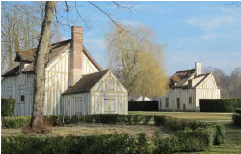
Abb. 1 Chantilly (Dép. Oise), Le Hameau du Château (2015)

Adelhart Zippelius hat sich in seinem bis heute als Standardwerk anerkannten „Handbuch der europäischen Freilichtmuseen“ (1974) auch zur Geschichte und zu eventuellen Vorbildern dieser Museumsgattung geäußert. Dabei kommt er auf die weilerartigen Ensembles ländlicher Bauten zu sprechen, die in der zweiten Hälfte des 18. Jahrhunderts in manchem Schlosspark entstanden sind. 1 Die bekanntesten sind „Le Hameau de Chantilly“, 1774 in dem dortigen Park der Fürsten Condé (Département Oise) eingerichtet, und „Le Hamau de la Reine“ von Marie-Antoinette, eine dorfartige Gebäudegruppe aus den Jahren ab 1784 neben dem Petit Trianon von Versailles. 2