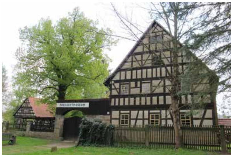
Abb. 5 Rudolstadt an der Saale, Thüringer Bauernhaus- museum, Gehöft aus Unterhasel (2017)

kann, und das Museum „Thüringer Bauernhäuser“ in Rudolstadt an der Saale angeführt, das 1914/15 gegründet wurde (Abb. 5). 10 Es ist zu betonen, dass auch in diesem Fall die Initiative nicht vom Staat, sondern vom Bürgertum ausging. Eine kleine, 1914 datierte Ehrentafel am Hauptgebäude würdigt das Engagement der Spender (Abb. 6).