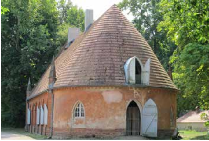
Abb. 3 Pfaueninsel, Berlin-Wannsee, Stall der Meierei (2015)

Können die französischen „Hameaux“, deren Bauten hin und wieder der ländlichen Architektur zum Verwechseln ähnlich sehen, und andere Parkprojekte als Vorläufer der Freilichtmuseen gelten? Dies trifft wohl nicht zu. Denn in keinem dieser Fälle gibt es translozierte Häuser, es geht nicht um die Bewahrung vom Abbruch bedrohter Architektur, dem Ganzen liegt auch keine pädagogische Absicht in Richtung der Wertschätzung überkommener ländlicher Bauten zugrunde.