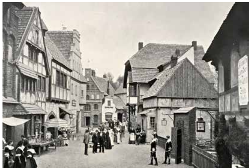
Abb. 4 Alt-Berlin, Spandauer Straße, nach einer Originalaufnahme von Ottomar Anschütz, aus: Prachtalbum der Berliner Gewerbeausstellung 1896

nachgebauter exotischer Dörfer mit „eingeborenen“ Bewohnern illustriert wurden, so führte der zweite in die Welt Ägyptens, die man mithilfe einer Vielfalt von Bauten, angefangen bei der Pyramide und bis hin zur Behausung der Fellachen, dem Publikum darbot. Die Ausstellungsorganisatoren konnten somit bei weitem die „rue de Caire“ der Pariser Weltausstellung von 1889 übertreffen.