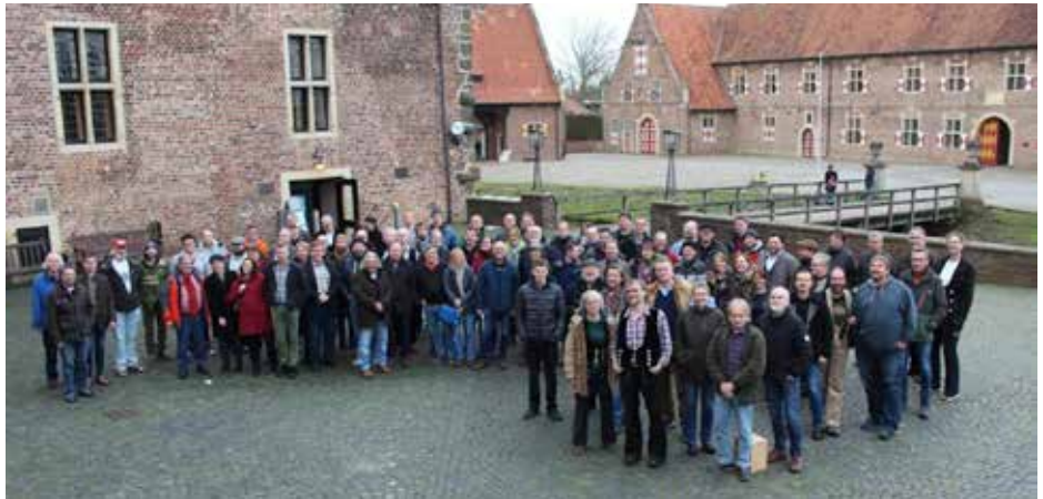
Die Fachtagung 2020 im Innenhof von Schloss Raesfeld

Das Dach mit Gebälk aus dem 13. Jahrhundert und der Dachreiter aus dem 19. Jahrhundert von „Notre Dame“ in Paris sind verbrannt. Europa erschrickt und sammelt Geld für irgend etwas zwischen Konservierung des Ist-Zustands, Rekonstruktion und Kreation eines modernen Dachreiters. Und Präsident Macron weiß schon, dass in fünf Jahren alles fertig sein wird.