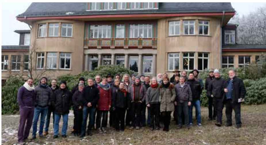
Sanatorium Dr. Barner, Landesgruppen Berlin/Brandenburg und Nord