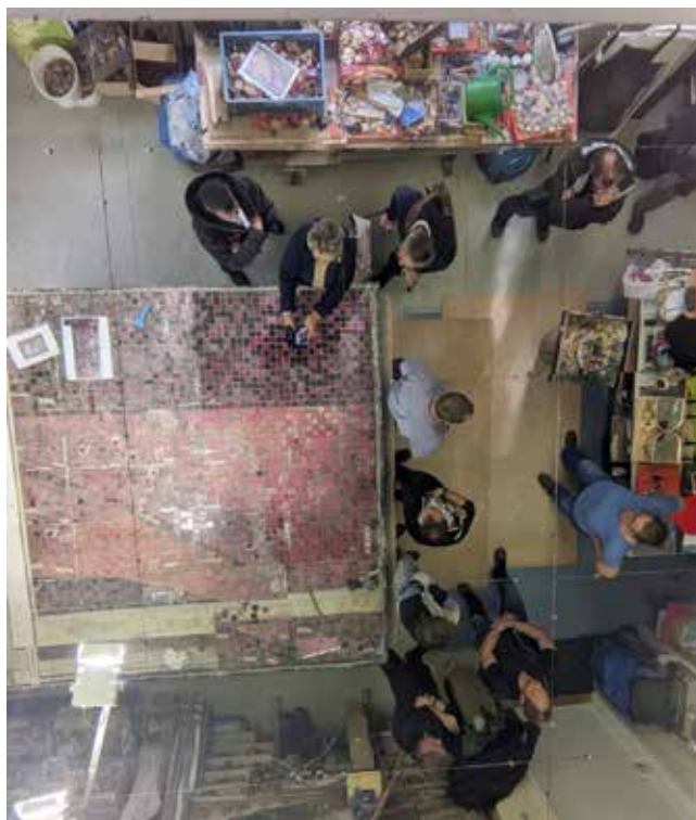
Atelier Dyroff, Blick in die Spiegeldecke über dem Werkstisch

Nach einer kurzen Begrüßung und Vorstellung der Tagesordnung durch den Landesgruppensprecher übernahm unser Gast