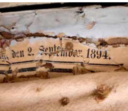
Abb. 2 Unterbespannung. Auf Jute geklebte Zeitung und Molton

An dieser Stelle kurz einige Worte zum generellen Aufbau historischer Wandbespannungen. Im 18. wie auch im 19. Jahrhundert wurden Wandbespannungen an Rahmen- oder Bretterkonstruktionen, welche direkt im Mauerwerk verankert waren, aufgenagelt. Wann oder warum welche Konstruktion verwendet wurde, ist Spekulation. Allerdings finden sich vollflächig verbretterte Untergründe in den Schlössern der Stiftung Preußische Schlösser und Gärten (SPSG) zum Beispiel an Stellen, wo eine Wandbespannung zusätzlich mit Applikationen wie Tressen und Crepinen 2 versehen wurde. Diese haben ein enormes Gewicht, wes-