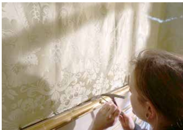
◀ Abb. 3 Beschwerte Seidenbespannung