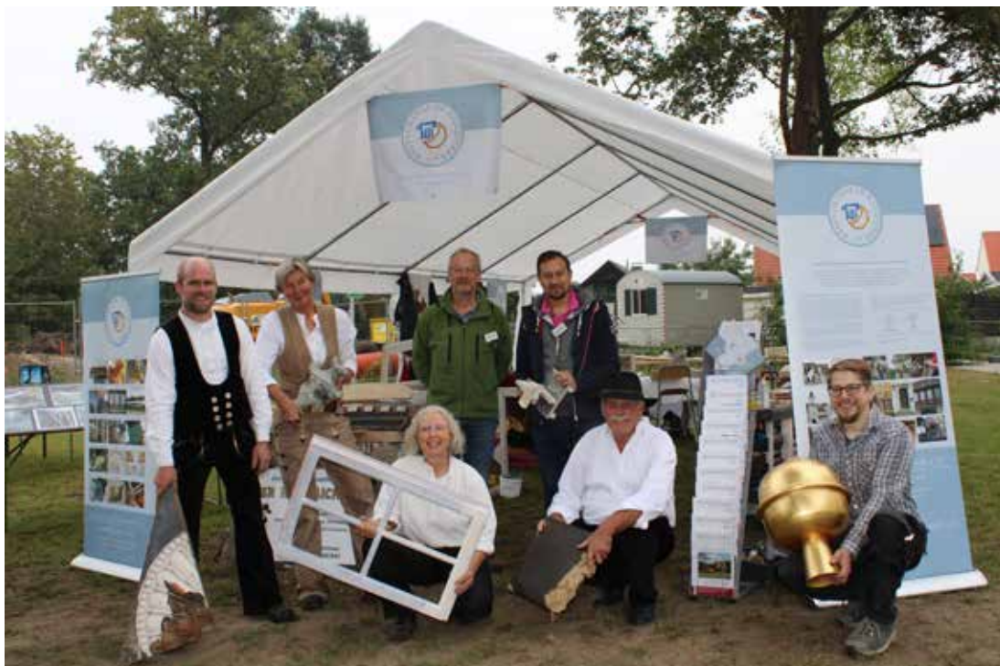
Zelt der Landesgruppe Nord vor der Villa Nordstern