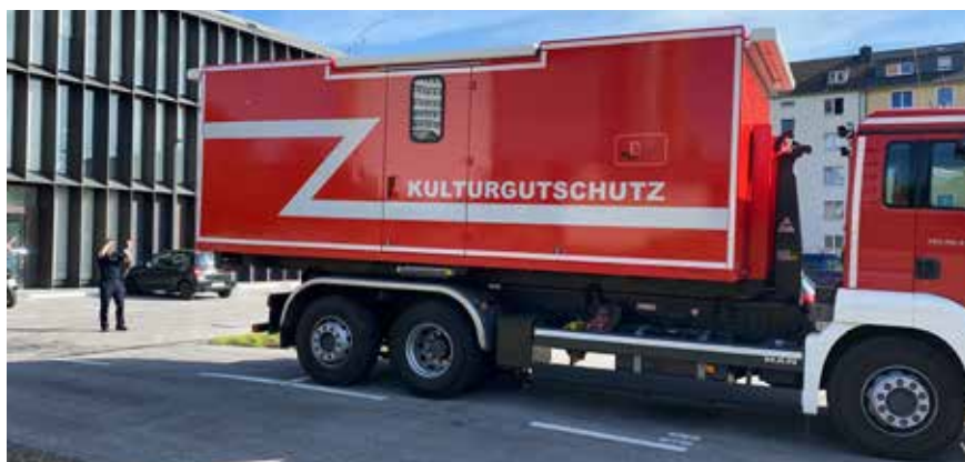
Dem Modellprojekt Abrollcontainer des Kölner Notfallverbundes sollen weitere Notfallcontainer für den Kulturgutschutz folgen.

Der in Leipzig präsentierte Abrollcontainer aus Köln soll als Prototyp künftiger Rettungscontainer dienen. Er lässt sich