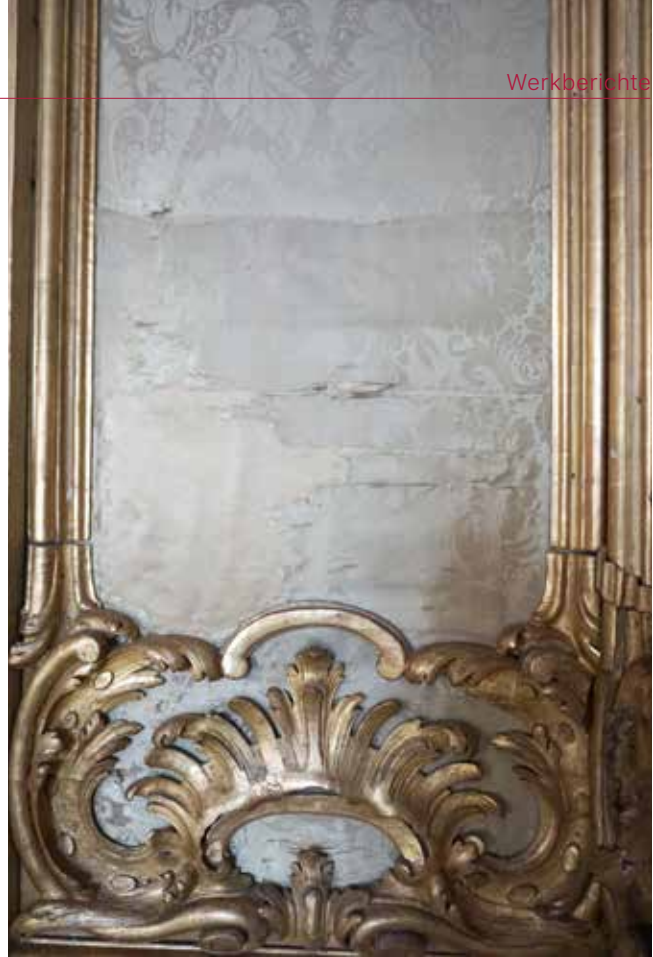
Abb. 1 Schadensbild eines kleinen Wandfeldes

Trotz des geringen Alters wies die Bespannung bereits in den 2010er Jahren starke Verschleißerscheinungen auf. Durch mangelnden Lichtschutz, klimatische Bewegungen und auch mechanische Schäden durch Besucher – Fasern oder kleine Textilstücke sind ein beliebtes Mitbringsel – zeigte sich das Textil nach verhältnismäßig kurzer Zeit in eben diesem Zustand (Abb. 1). Die Schäden traten verstärkt im unteren Drittel auf. Bereits 1986 wurde die erste Restaurierungsmaßnahme vorgenommen. Hier wurde zur Restaurierung an mehreren Stellen partiell ein Seidengewebe unterlegt, um die stark zerschlissene Bespannung zu sichern. Die deutlichsten Fehlstellen bildeten sich auf den direkt von der Abendsonne betroffenen und von Besuchenden unsachgemäß behandelten Stellen. Der Alkoven dagegen zeigte sich in einem relativ guten Zustand. Es wurden mehrere Varianten zum Umgang mit den Textilien in Fachgremien besprochen und diskutiert. Generell ist das Konservieren und Restaurieren von Wandbespannungen oft eine sehr zeitintensive Arbeit, da es meist in situ geschehen muss.