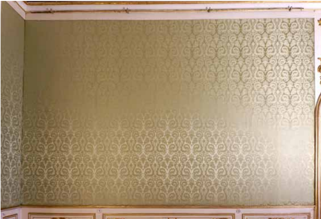
Abb. 6 Fertige Wandbespannung ohne Abdeckleisten im Randbereich

aus jeweils nach oben und unten. Dabei wurde das Gewebe unterseitig gleich nach innen geschlagen, während die Seiten offenkantig verbleiben. In diesem Zustand muss die Bespannung nun wieder akklimatisieren, im Idealfall mindestens 24 Stunden.