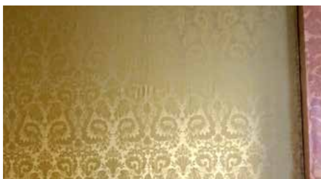
Abb. 5 Fertig geheftete Bespan- nung mit Faltenbild

halb partiell zusätzlich Nägel in der Fläche eingeschlagen wurden – wahrscheinlich um eben das Gewicht durch die zusätzlichen Tressen abzufangen. Während im 18. Jahrhundert das Textil ohne Unterbespannung direkt auf die Unterkonstruktion genagelt wurde, änderte sich dies spätestens im beginnenden 19. Jahrhundert. Die Übergänge dürften fließend gewesen sein. In Schloss Wörlitz fanden wir beispielsweise eine durch Handnähte zusammengenähte und geschmiedete Nägel befestigte Unterbespannung vor. Ob diese jedoch bauzeitlich um 1773 war, konnte nicht bestimmt werden. Aufgrund der erwähnten Verarbeitungsspuren wird sie aller Wahrscheinlichkeit nach frühestens aus dem ersten Drittel des 19. Jahrhundert stammen. Im weiteren Verlauf des Jahrhunderts entwickelte sich dann die Art Unterbespannung, welche bis heute an historischen Wandbespannungen Anwendung findet – ein auf die Leisten genageltes und mit Papier kaschiertes Untergewebe, gefolgt von einem ebenfalls angenagelten Moltongewebe. Diese Art der Unterbespannung hat sich bewährt und findet bis heute Verwendung.