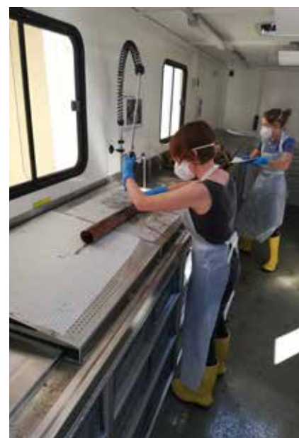
Restauratorinnen reinigen verschlammte Objekte mit Wasser im Kölner Abrollcontainer nach der Flut im Ahrtal.

Glücklicherweise gelang mit dem Notfallcontainer aus Köln die Rettungsaktion für das Stadtarchiv in Stolberg und das Stadtmuseum im Ahrtal ohne festgezurrte Strukturen. Ein konzertiertes Handeln gilt es noch zu entwickeln und das Netzwerk zu stärken, das bereits aus zahlreichen Fachverbänden und Organisationen geknüpft wurde. Sie alle möchten das kulturelle Erbe in allen Phasen einer Krise wirksam und nachhaltig schützen und erhalten. Auszubauen sind Mechanismen, um in einer Krise effizient beim Bergen und Sichern von Kulturgut unterstützen zu können.